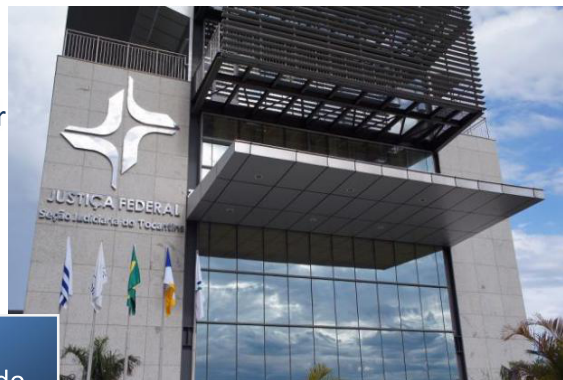
Seção Judiciária do Tocantins