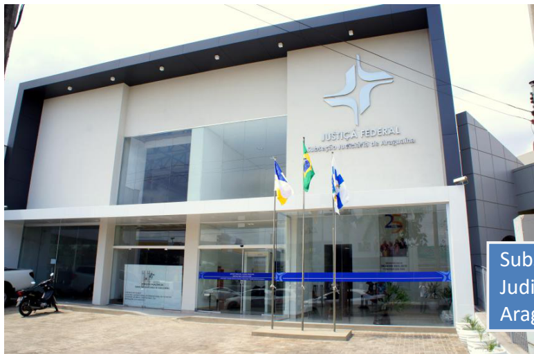
Subseção Judiciária de Araguaína