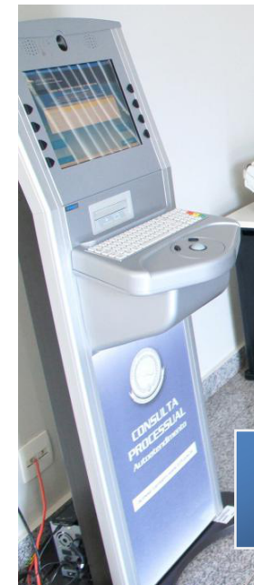
Terminal de Auto-Atendimento Palmas