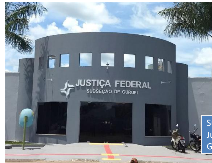
Subseção Judiciária de Gurupi