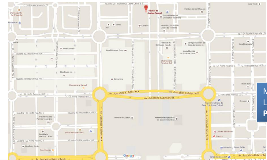
Mapa de Localização Palmas